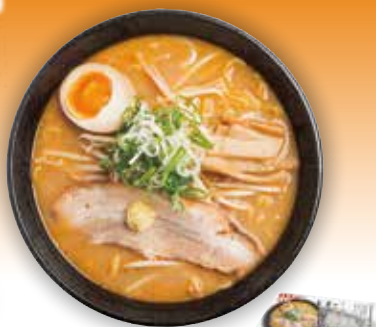
35 札幌らーめん 四代目いちまる