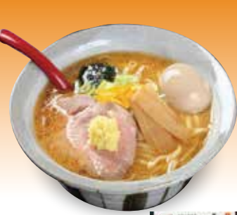
37 金沢 味噌ラーメン専門店 大河

特定原材料:小麦 内容量:生麺 中太ちぢれ麺 110g×4 焙煎ごま味噌 スープ62g×4 賞味期限:90日 ㈱久保田麺業