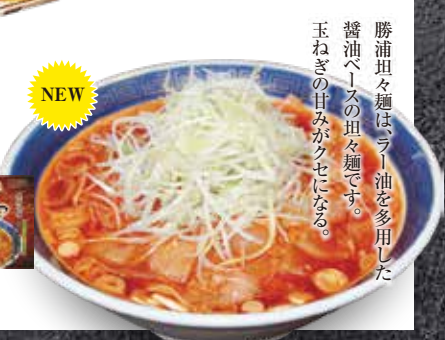
40 勝浦式 担々麺 江ざわ