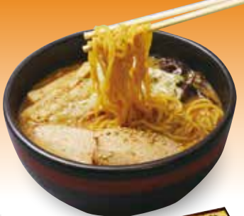
36 札幌のらーめん 吉山商店

特定原材料:小麦・卵 内容量:生麺 ストレート麺120g×4 スープ50g×4 賞味期限:45日 ㈱クックランド