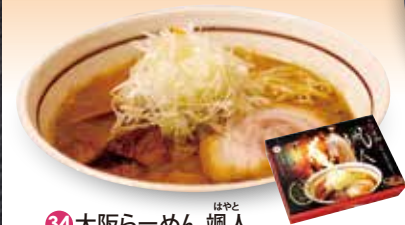
34 大阪らーめん 蛸人

濃厚ながらあっさりとした後味のスープに、 生姜・柚子・青のりが旨味を引き立てる。