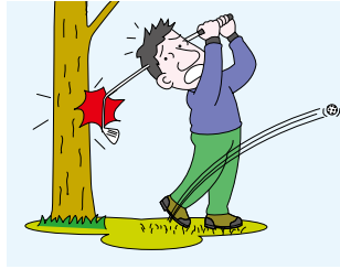
ゴルフクラブの破損