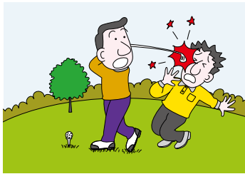
ゴルフ中の賠償事故